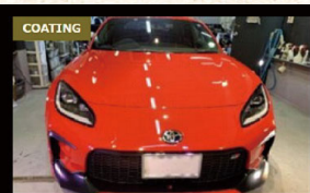
TOYOTA GR86 コーティング施工