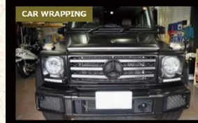
MercedesBenz Gclass フララッピング