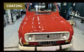
RENAULT RENAULT4 コーティング施工