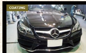
MercedesBenz E 250 ボディコーティング & 幌コーティング